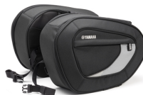
Soft Bag - Satteltaschen